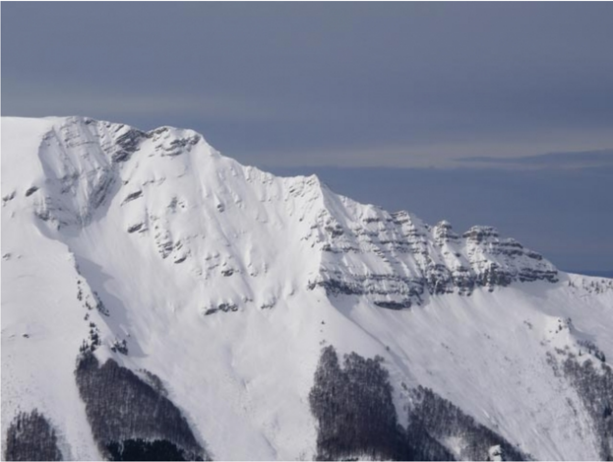
Rauher Kamm im Winter