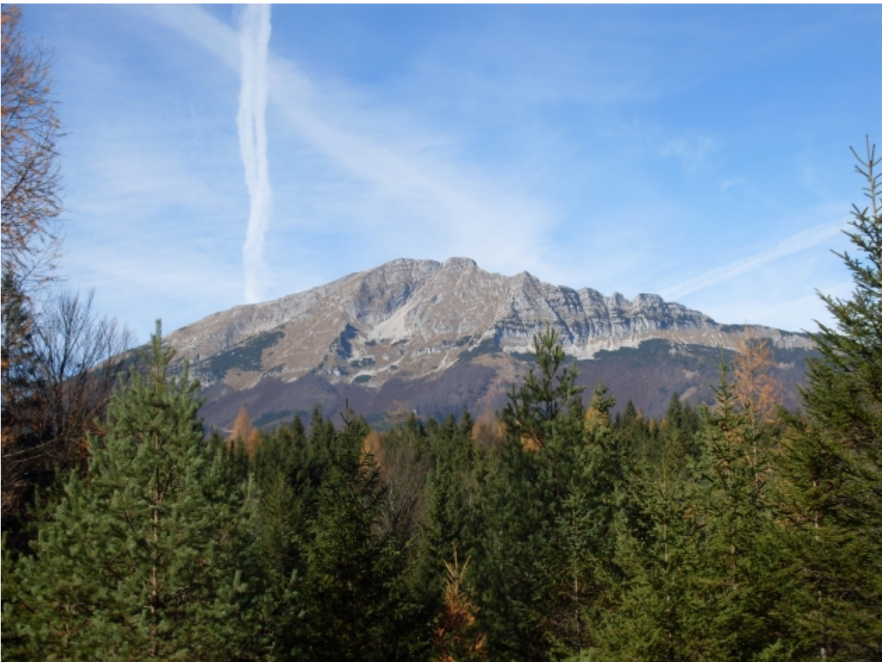
Gesamtansicht von Süden, rechts der Rauhe Kamm