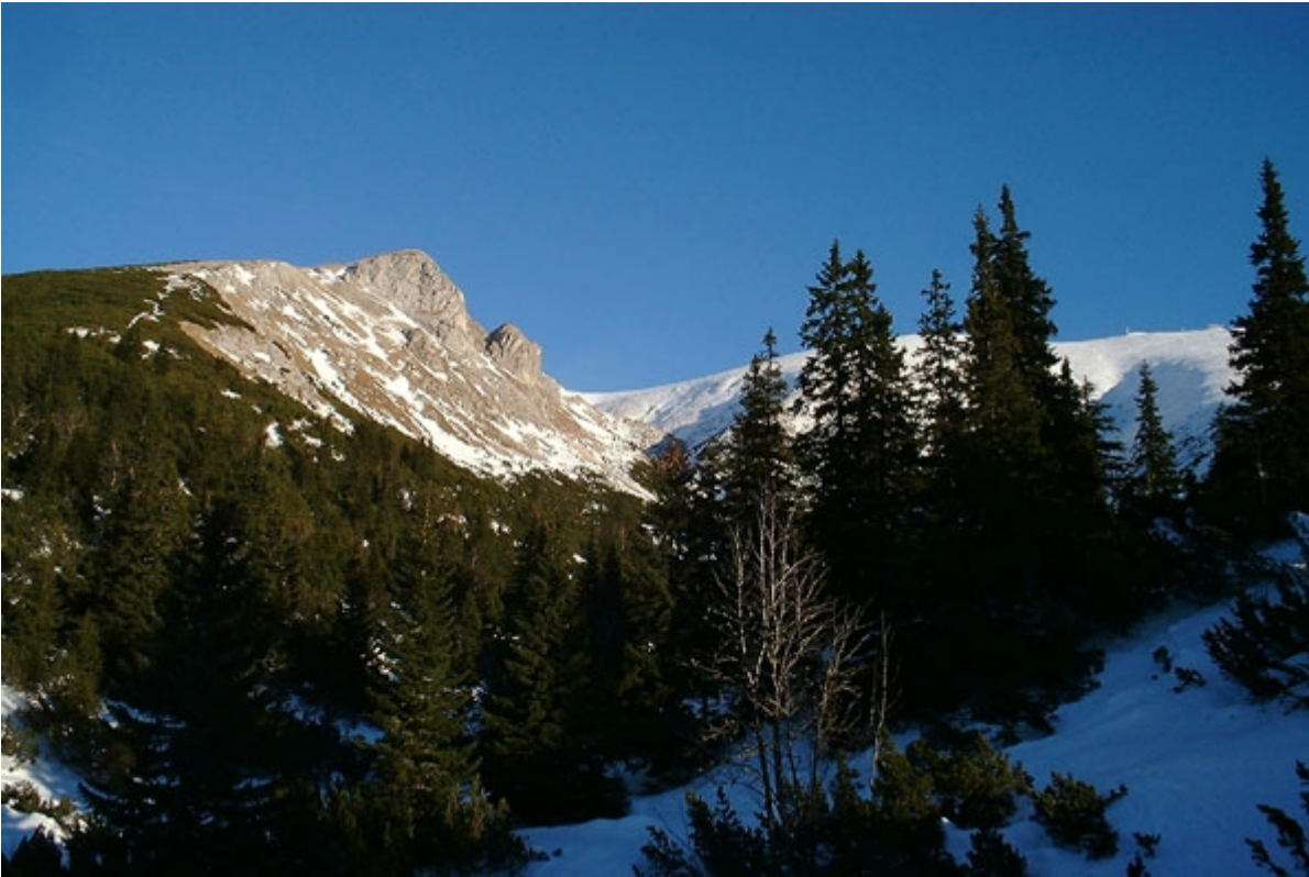
...von der Krempl Hütte aus gesehen.